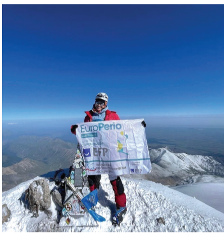
3-е место. «Покорение Эвереста». Кафедра стоматологии терапевтической и пародонтологии