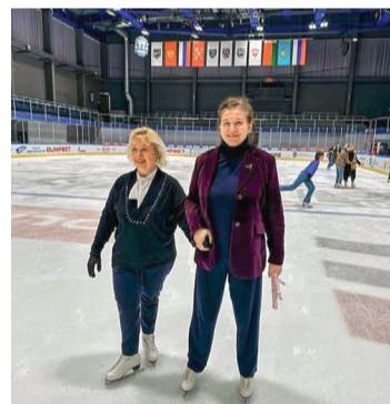
«Равнение сотрудников кафедры на руководство!» Кафедра пропедевтики стоматологических заболеваний