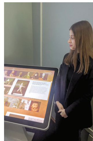
Виртуальный филиал Русского музея работает на кафедре истории

Студенты педиатрического факультета, 150-я группа