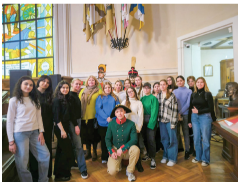
«Экскурсия в Музей А.В. Суворова». Институт сестринского образования