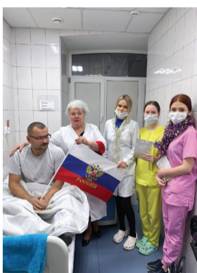
«Студенты ИСО поздравляют в госпитале участника СВО». Институт сестринского образования