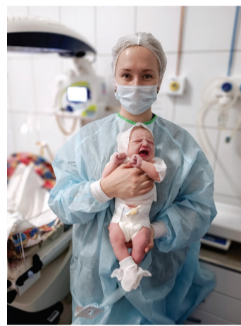
Приз симпатий. «Рождение новой жизни. Самая лучшая работа». Родильное отделение. Клиника акушерства и гинекологии