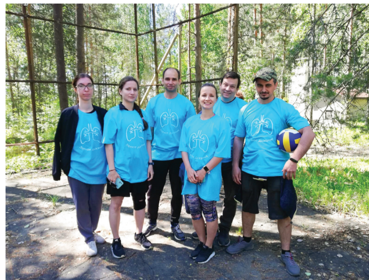
2-е место. «Спартакиада». Кафедра терапии госпитальной с курсом аллергологии и иммунологии им. акад. Черноуцко с клиникой