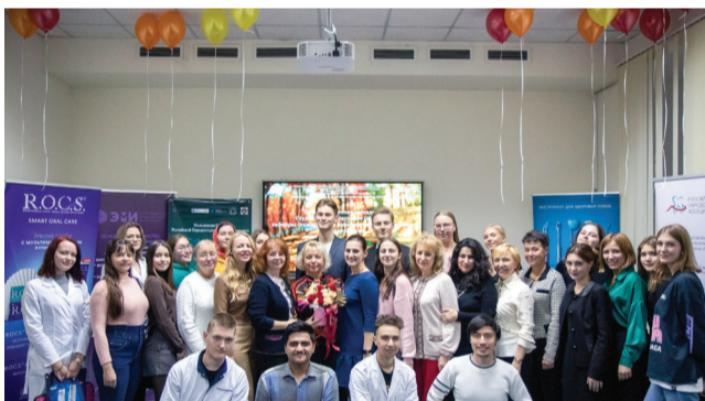
«СНО кафедры стоматологии терапевтической и пародонтологии». Кафедра стоматологии терапевтической и пародонтологии