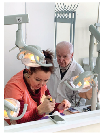
«Экспериментальное исследование». Кафедра пропедевтики стоматологических заболеваний