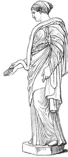
«Гигиена». Репродукция. Век. 1905 год.