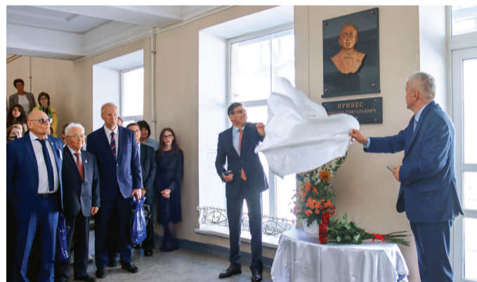
Торжественное открытие мемориальной доски М. Г. Привесу в 30 корпусе. 16 мая 2024 года

В 1932 году ассистент М. Г. Привес создает рентгеновский кабинет, позволяющий «без ножа и боли» изучать анатомию конкретного живого человека