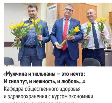
«Мужчина и тюльпаны — это нечто: И сила тут, и нежность, и любовь...» Кафедра общественного здоровья и здравоохранения с курсом экономики и управления здравоохранением