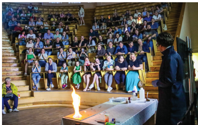
Химическое шоу во время «Ночи музеев» увидели 1300 человек

Больше всего событий прошло в Анатомическом корпусе. Гости побывали в Музее истории Университета, где познакомились с прошлым и настоящим медицинской науки, а после исторической викторины – сдачи «экзамена», экскурсанты получили сувениры от директора Женского медицинского института и инспектрисы. В блокадной части экспозиции волонтеры в военной форме проводили экскурсии в историю 1 ЛМИ в военные годы. В следующем зале Музея студенты ИСО рассказали о работе медицинской сестры и проводили на фантомах мастер-классы по базовым манипуляциям, наиболее увлекшие посетителей – внутримышечные инъекции в ягодичную мышцу. В одной из самых зрелищных аудиторий – «семерке», посетители высоко оценили химические опыты (эксперименты «Содовая