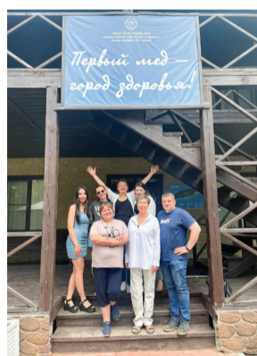
«Любим Васкелово шарм». Стационар дневного пребывания клиники акушерства и гинекологии