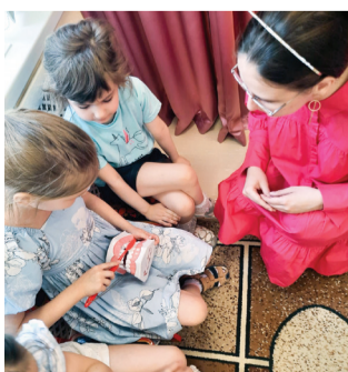
Урок здоровья в детском саду

В преддверии празднования Дня защиты детей кафедра стоматологии детского возраста и ортодонтии под руководством заведующего