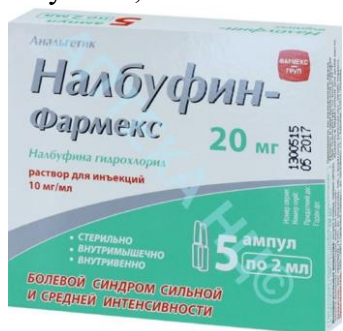
Лекарственный препарат в ампулах