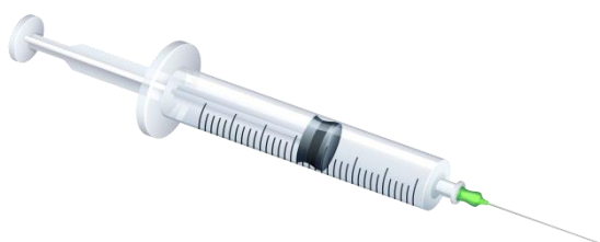
Шприц для инъекций