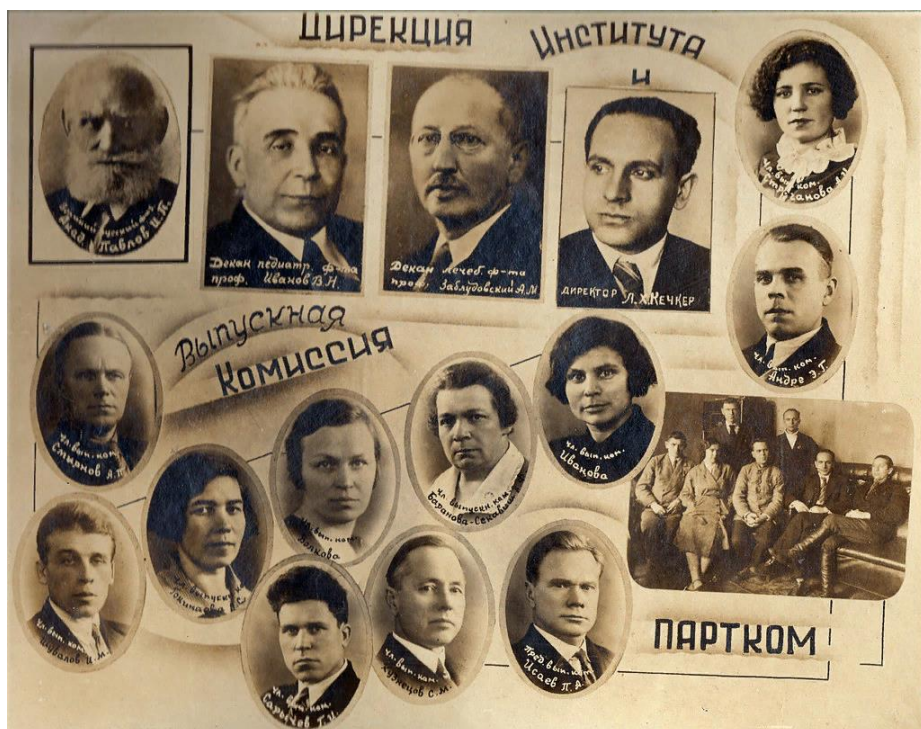
Фотография из выпускного альбома 1ЛМИ 1937 г.