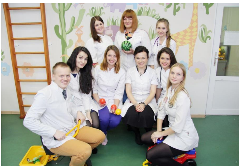
Первый выпуск нового Педиатрического факультета 27 июня 2014 года.

Таким образом, студенты Педиатрического факультета, обучаясь в стенах ПСПбГМУ им.И.П.Павлова, перенимают знания и традиции одной из ведущих медицинских школ. Выпускники Педиатрического факультета Первого Меда, являясь компетентными высококвалифицированными специалистами, пользуются большим спросом у работодателей во всех лечебных учреждениях страны.