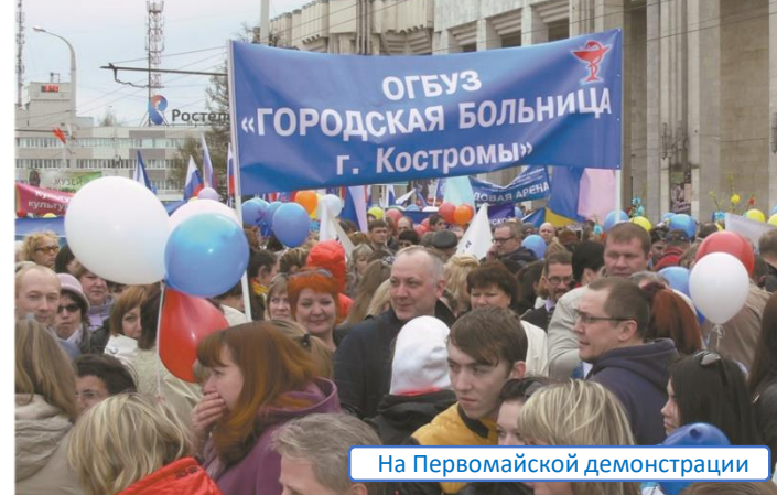
На Первомайской демонстрации

Общее число сотрудников - свыше 1300 человек.