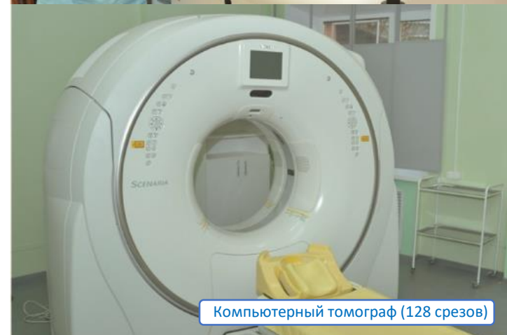
Компьютерный томограф (128 срезов)