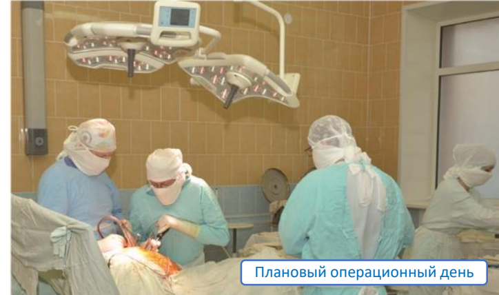
Плановый операционный день