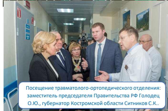
Посещение травматолого-ортопедического отделения: заместитель председателя Правительства РФ Голодец О.Ю., губернатор Костромской области Ситников С.К..