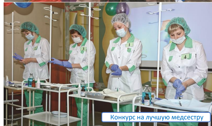
Конкурс на лучшую медсестру