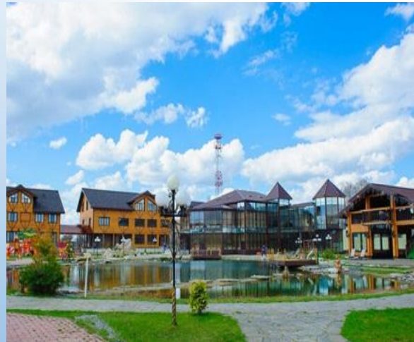
Гостиничный комплекс Бережки-Холл