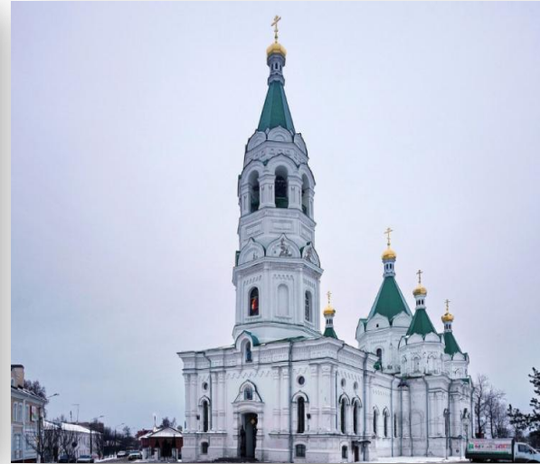
Храм Александра Невского