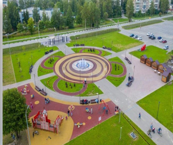
Парк «200 лет Егорьевску»