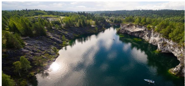
Горный Парк Рускеала